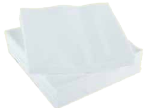
Servilletas blancas o rollo de cocina