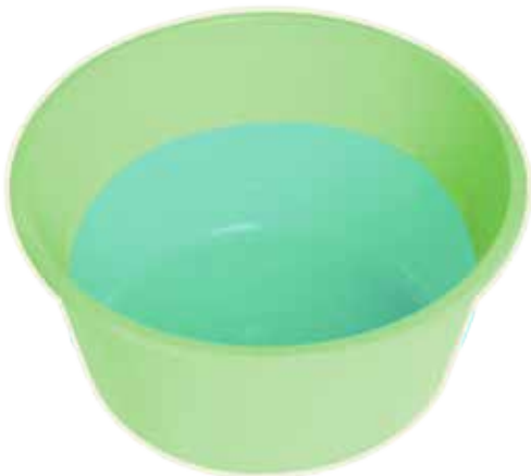
Un cuenco con agua tibia