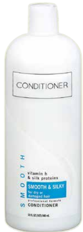
Crema suavizante, acondicionador o bálsamo

Puedes comprar una buena lendrera en la farmacia. La lendrera tiene dientes muy finos y angulosos que están muy juntos y que no se pliegan.